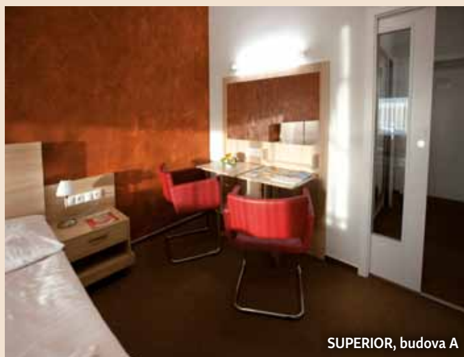
SUPERIOR, budova A

35x dvoulůžkový (možnost volby oddělená/společná postel) pokoj bez balkonu (4 dvoulůžkové pokoje bez balkonu bezbariérové)