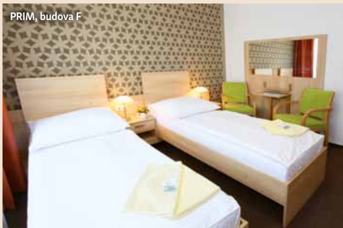
PRIM, budova F