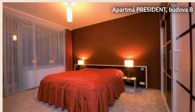
Apartmá PRESIDENT, budova B

schránky, telefon, Sat TV + DVD, rádio s CD přehrávačem, balkon s markýzolety.