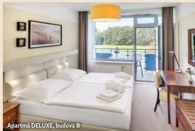
Apartmá DELUXE, budova B

2x třípokojové apartmá (1x společná postel a 2x oddělená postel) bez balkonu, max. 5 osob