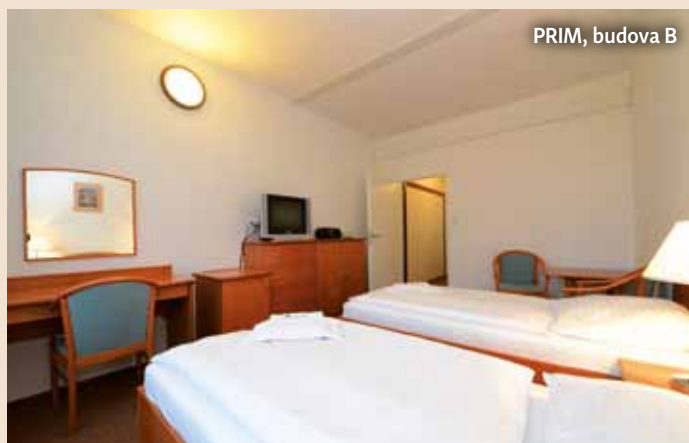
PRIM, budova B

Chcete zažít relaxaci ve spojení s výjimečnou lázeňskou péčí uprostřed nekonečné zeleně lázeňského parku na břehu rybníka Svět? Moderní prostory lázeňského domu Aurora nabízejí dokonalou harmonii lázeňství a přírody – prvotřídní lázeňskou léčbu, wellnesscentrum, moderní gastronomii a komfortní ubytování na vysoké úrovni. To vše pod jednou střechou s překrásnými výhledy do rozlehlého lázeňského parku. Díky tomu si můžete užívat v každém ročním období lázeňskou léčbu spojenou s relaxací, ale i dny aktivního odpočinku. Celková ubytovací kapacita Lázní Aurora je 562 lůžek ve 289 pokojích.