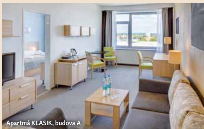
Apartmá KLASIK, budova A