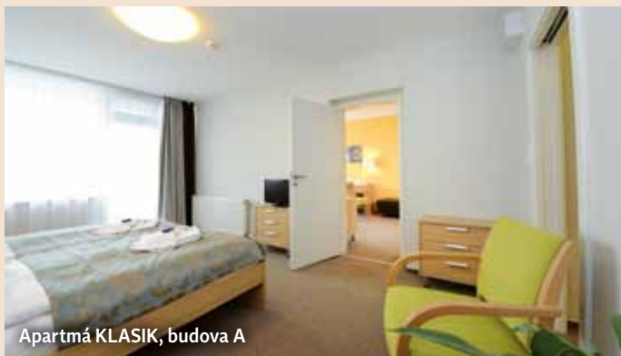
Apartmá KLASIK, budova A