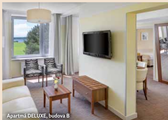
Apartmá DELUXE, budova B