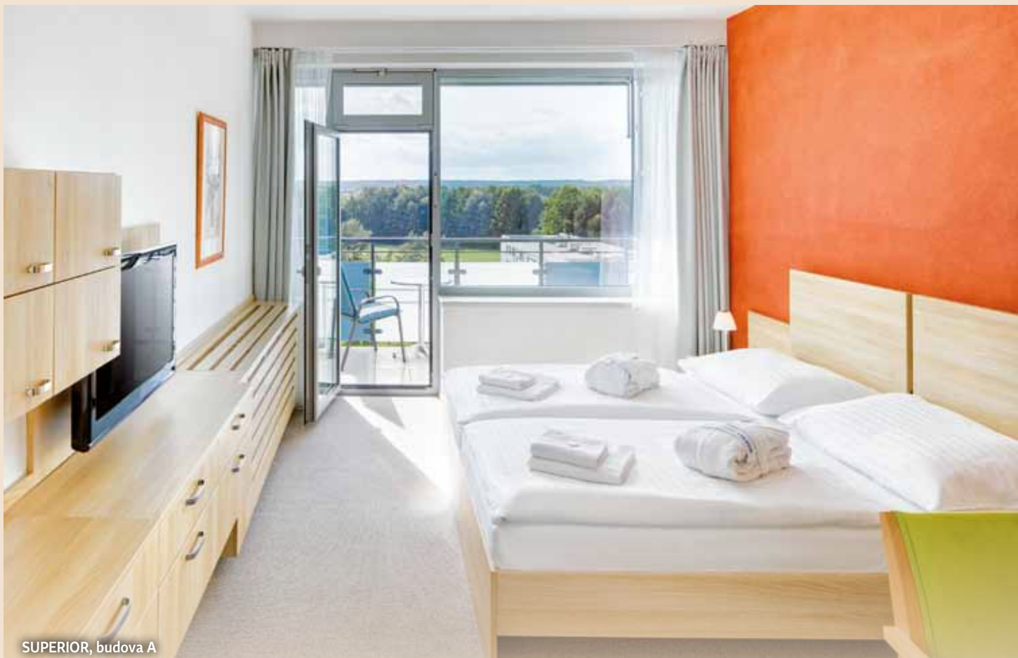
SUPERIOR, budova A