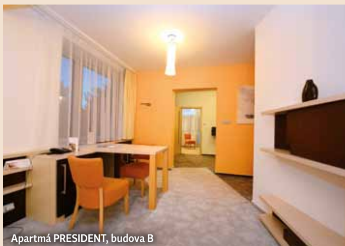
Apartmá PRESIDENT, budova B

Apartmá sestávající z obývacího pokoje, ložnice, pracovny, samostatné koupelny se sprchovým koutem a vanou a samostatného WC nabízejí následující vybavení: župany, pantofle, fén, lednice (nápoje na přivítání), balená voda, varná konvice, bezpečnostní